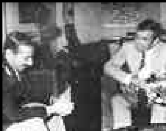
VIDELA CON RUCAUF

"La violación sistemática de los derechos humanos no fue producto de excesos cometidos por algunos militares sádicos, sino la consecuencia de una lógica económica. Fueron los empresarios quienes ganaron con los crímenes, aunque no se ensuciaran las manos. La industria, unida con consorcios extranjeros, pudo atesorar de este modo ganancias astronómicas"